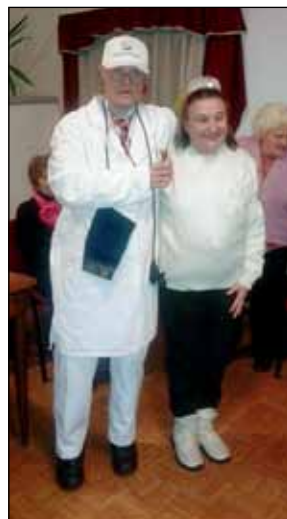
Most nincs beteg szerencsére!