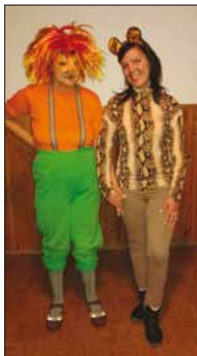
A Pogonyi lányok

A télbúcsúztató alkalomból megrendezett farsangi bál visszatérő esemény a „Simogató Kéz” kis közösségének életében. Az idén január negyedik hétvégéjén karneválunk olyan jól sikerült, mint az ezt megelőző években! Ilyenkor odahaza készült finom süteményekkel és farsangi fánkkal kedveskedünk egymásnak. A fiatalok az idén is nagyon ötletes, kreatív jelmezekben vultak fel. Egy párat említénék: volt sportoló,