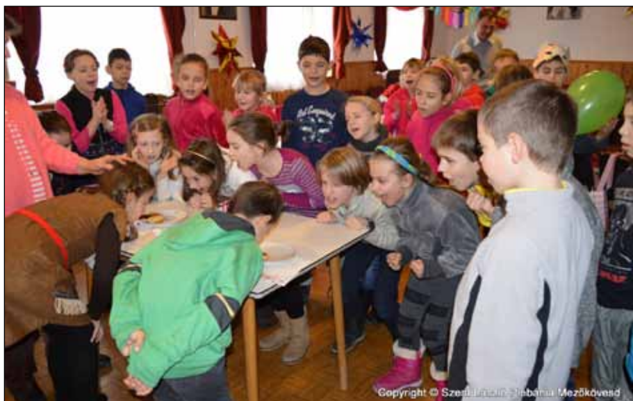
A vidám résztvevők