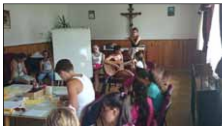
Foglalkozás a hittanteremben