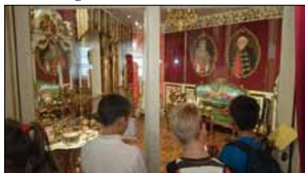
Gyönyörködtünk a látottakban