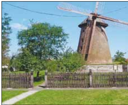
A karcagi malom, ami mindenkinek nagyon tetszett