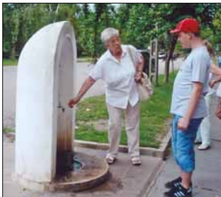
A kútból is gyógyvíz folyik

„Nagyon megörültem annak a hírek, hogy nagymamám elvisz magával a táborba. A csoport tagjait már ismertem, találkoztunk strandon, színházba, sőt egy foglalkozáson is részt vehettem, ahol origamiztam a fiatalokkal és szüleikkel. Meg beszélgettem, énekelünk, játszottunk.