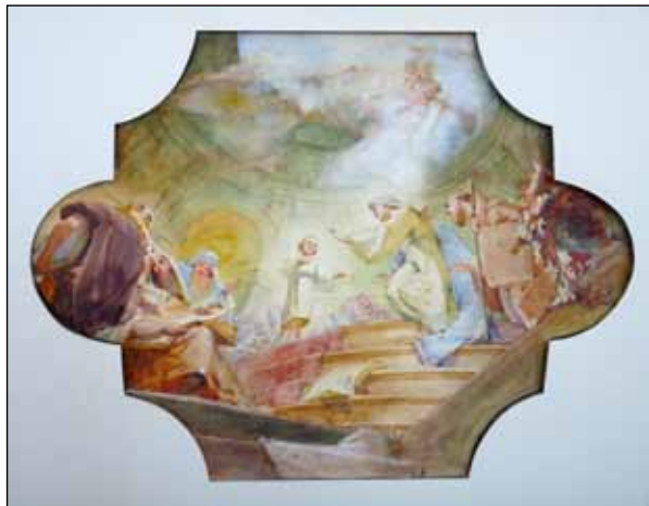
„Miért kerestek engem?”

mi Boldogasszony Anyánk, régi nagy Pátrónánk. (Szent Gellért szorgalmazta, hogy a Szűzanyát magyarul Boldogasszonynak nevezzék. Mária szeplőtelen fogantatásában párhuzamot láttak őseink Emese Turul madártól történő fogantatásával, az Árpád-nemzetség származásával; az angyali üdvözléssel pedig Emese álma rokonítható.)