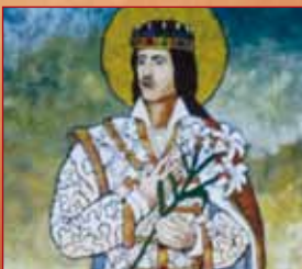
Szent Imre tisztelete