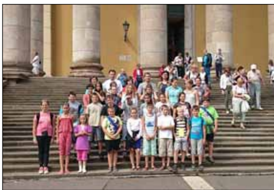
Egerben, a Bazilika előtt

Másnap autóbusszal Gyöngösre látogattunk. A Szent Bertalan temp-